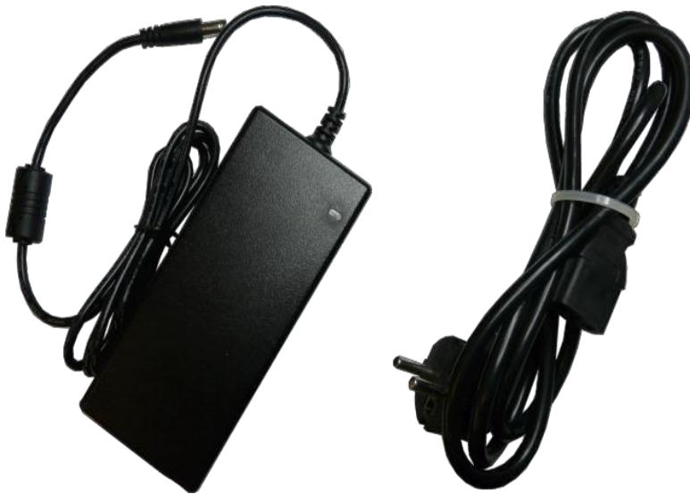
Slika 3. AC/DC adapter 12V/3A