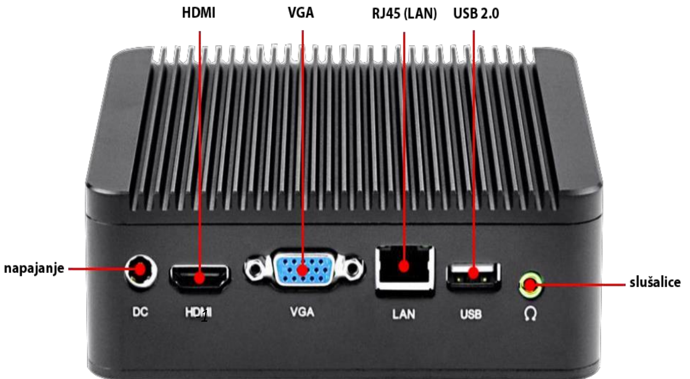
Slika 2. SG-2 zadnji panel – lokacija i tip konektora